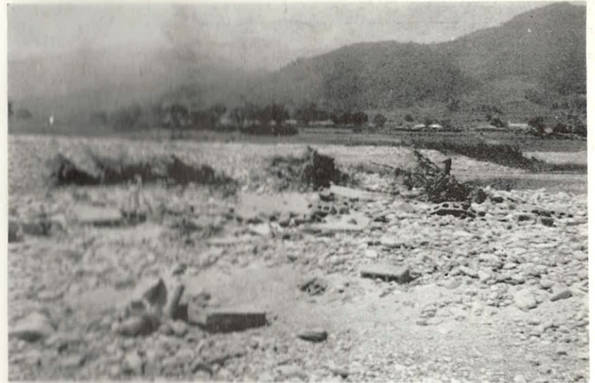
뜨거운 뽕포에는 모래와 돌만의 켜허위에 이렇게 結晶되어 再起의 원동력이 된다.