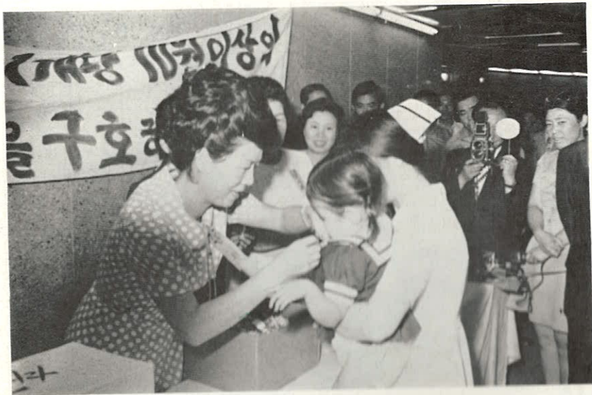
한사람 한사람의 조그마한 정성이 모여 지레의 불행은 조금이라도 도움코자 한다.