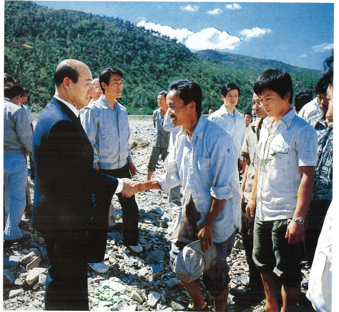
전두환 대통령께서 수해지구를 시찰코 관계관에게 신속한 재해복구사업을 지시한 후 주택과 재산손실을 당한 이재민에게 힘차게 재기할 것을 당부하셨다.